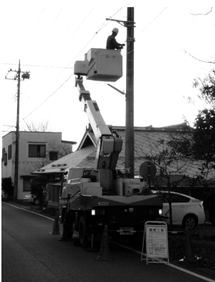
光ファイバの敷設工事