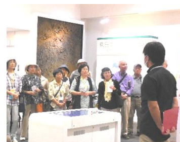
🚌移動教室いわき防災