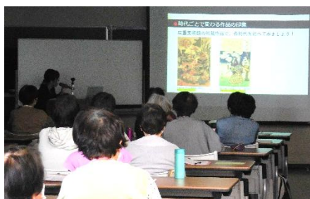
『べらぼう』浮世絵の世界へ