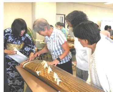
♫お箏を弾いてみよう