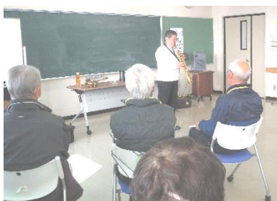
♫サクソフォンにうっとり