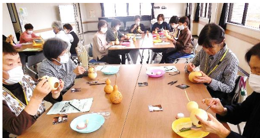
創作ひょうたんランプ作り