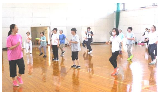
リズムダンスでリフレッシュ