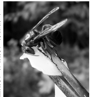
スズメバチの生態について詳しく展示・解説します

生息環境、危険度、危険回避などについて解説します。 自然観察館で飼育、羽化させた生体展示では、ヘラクレスオオカブトムシなどに加え、パラワンオオヒラタも登場します。直接ふれあえるクワガタもいますので、ご家族みなさんでお試しください。 お問い合わせ ふれあいの丘自然観察館 TEL (28) 3131