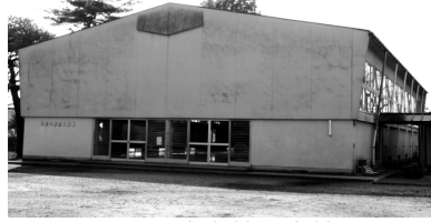
旧川西中学校体育館

新「黒羽中学校」の開校に伴い、従来の川西中、黒羽中、須賀川中、両郷中の体育施設（体育館、校庭）についての利用申請窓口が、スポーツ振興課に変わります。詳細は、スポーツ振興課または黒羽体育館までお問い合わせください。