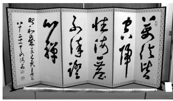
豊道春海翁の作品

○ほかに、TBC学院との連携講座や市教育委員会主催事業に参加する特別講座あり。内容などが変更となる場合あり。