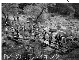
昨年の市民ハイキング