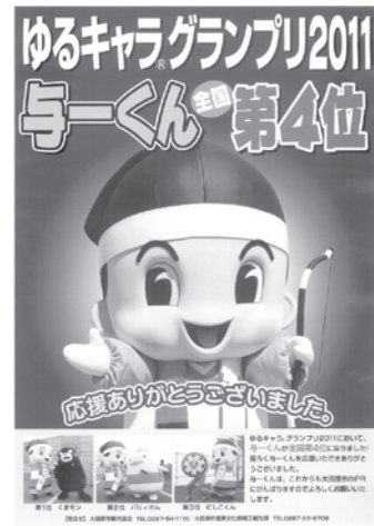
ゆるキャラグランプリで全国4位に輝いた与一くん