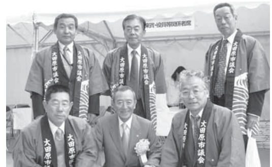
江東区民まつりで江東区長と