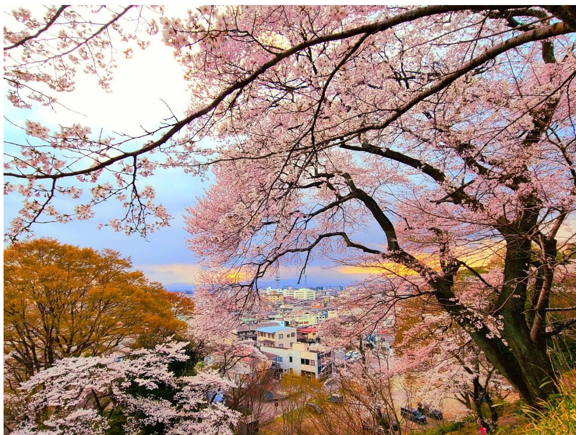
撮影場所【大田原市 城山公園】