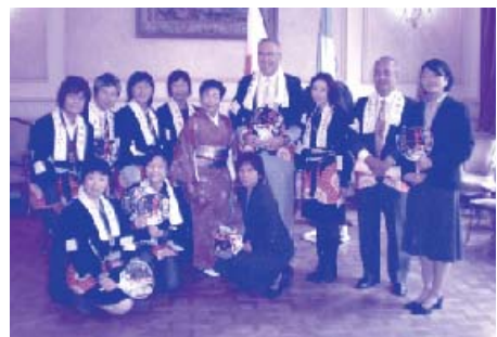
カヴァイオン市表敬訪問

なる「心」の部分は、共通であると感じる事が出来ました。2泊のホームステイでは、言葉や生活習慣の違いからホストファミリーと出会うまでは不安でしたが、別れの時は感謝の気持ちでいっぱいになり涙があふれてきました。研修で得られた知識や経験を今後の地域社会への貢献に生かしていきたいと思えます。