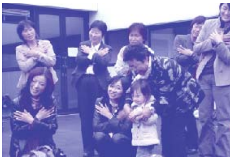
フランス保育園研修

これらの問題における他国の取組みや、考え方、また、生活習慣・文化を学び日本との違い、特徴を知り視野を広めることが出来ました。また、それと同時に国や文化は違っていてもベースと