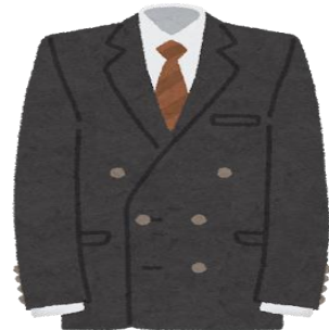
スーツ、Yシャツ、ネクタイ