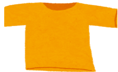
Tシャツ、ポロシャツ