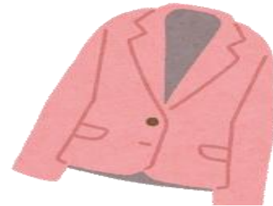
ジャンパー、ジャケット