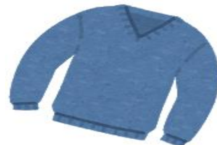
セーター、トレーナー