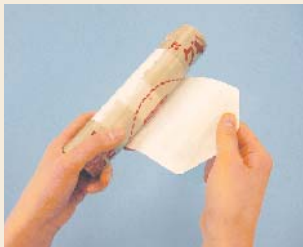
① 紙ラベルを取り外す