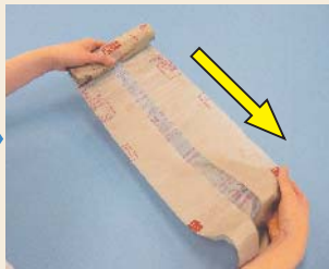
② 袋をミシン目まで引き出す